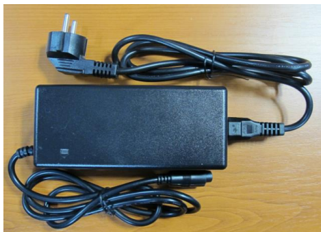
Set nabíječky baterie